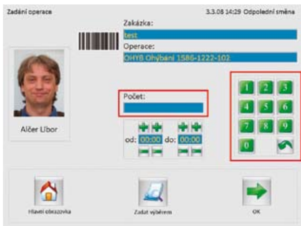
Vykazování výrobních operací pomocí MES Kiosku.

Jednoduchost ovládání je podpořena použitím názorných grafických symbolů, které podstatně zvyšují již tak rychlou orientaci uživatelů v programu. Díky těmto vlastnostem je maximálně snižena i čas potřebný na zaškolení nových uživatelů systému. Pro přihlášení a autorizaci uživatelů může být využito čárových kódů, karet s magnetickým proužkem nebo RFID čipů.